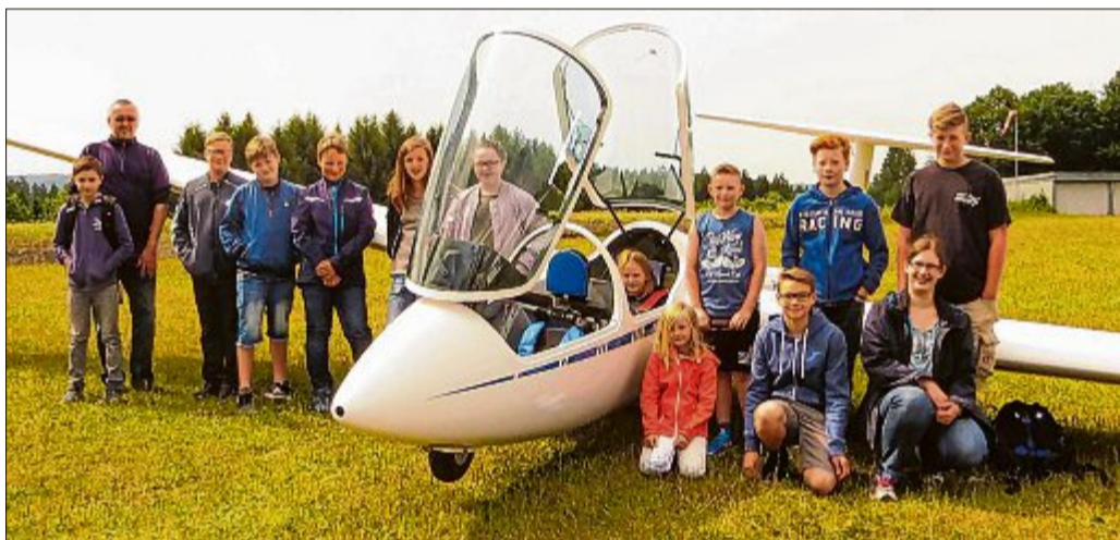
Abheben und die Welt von oben betrachten: Das war ein ganz besonderes Erlebnis für die Kinder, die beim Ferienangebot des SFC Betzdorf-Kirchen zu Gast waren.

Betzdorf/Kirchen. 38 Kinder im Alter von neun bis 14 Jahre begrüßte der SFC Betzdorf-Kirchen jetzt zu einer Ferienspaßaktion auf dem Flugplatz in Katzwinkel-Wingendorf. Zunächst erhielten sie eine eingehende Einweisung zum sicheren Verhalten auf dem Flugplatz. Dann wurden die Instrumente und Steuerorgane der Segler erklärt. Zuletzt kam der automatische Fallschirm an die Reihe, den alle vor dem Einsteigen anziehen müssen. Dann ging es endlich in die Luft, zuerst für die Mädchen. Die anderen Kinder lernten, das Schleppseil vom Schleppflugzeug zum Segler zu