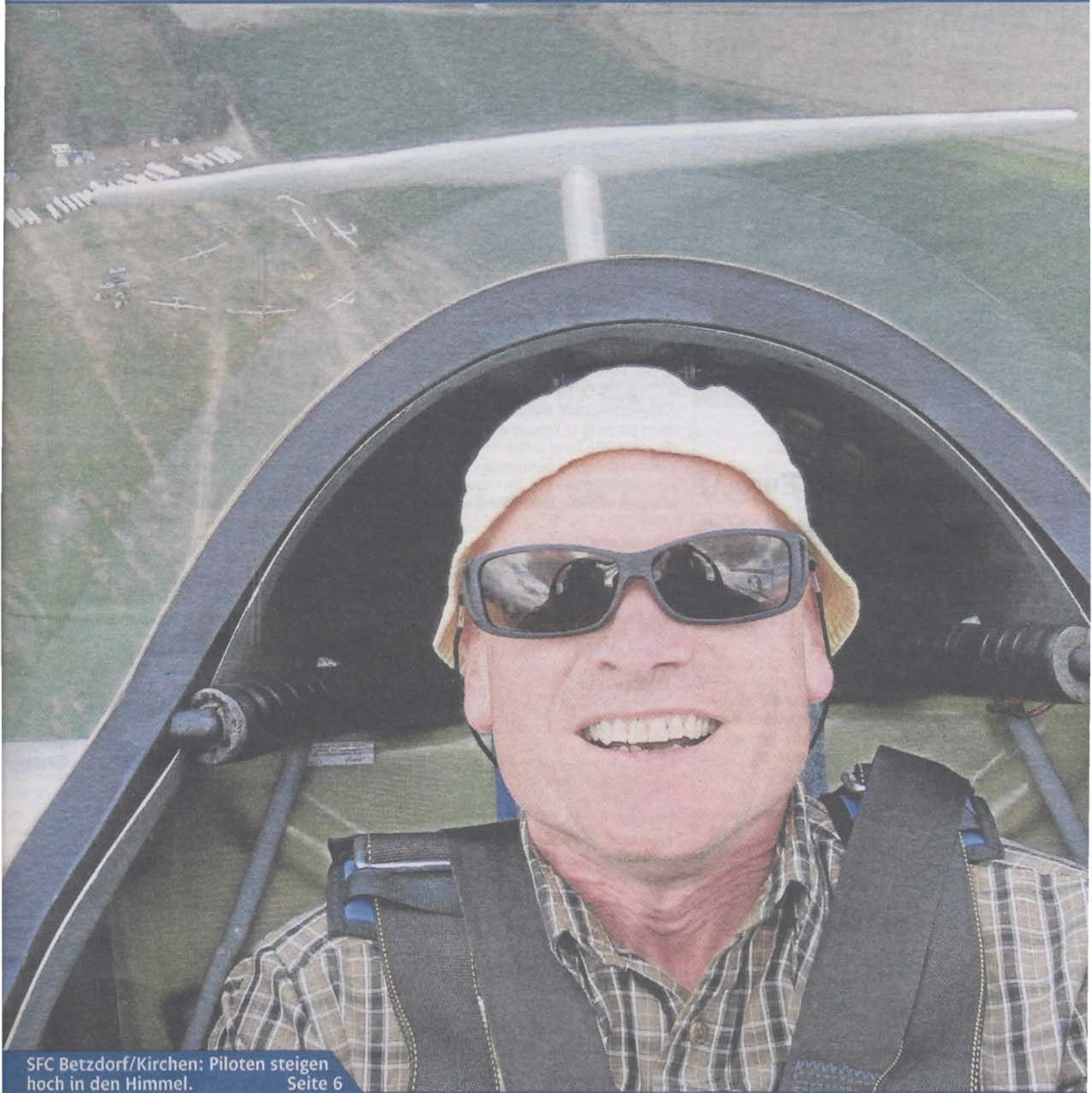
SFC Betzdorf/Kirchen: Piloten steigen hoch in den Himmel. Seite 6

HEIMATAUSGABE KREIS ALTENKIRCHEN (OBERKREIS) Betzdorf · Kirchen · Daaden · Herdorf · Gebhardshain · Siegerland